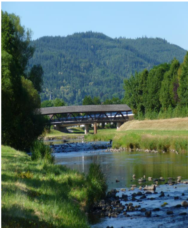
Blick auf den Flößersteg