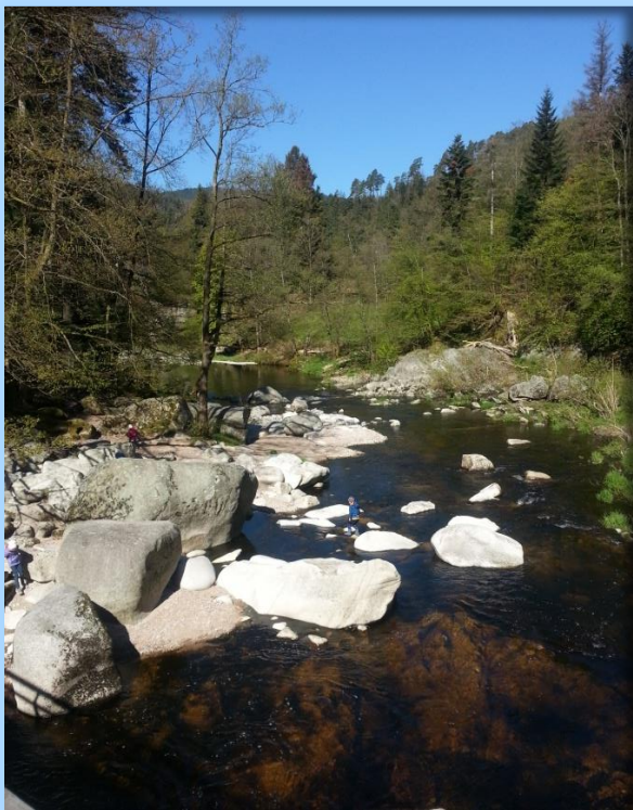
Blick auf die Murg